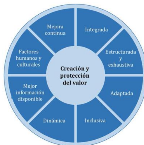
Figura 2 — Principios

La gestión del riesgo eficaz requiere los elementos de la Figura 2 y puede explicarse como sigue.