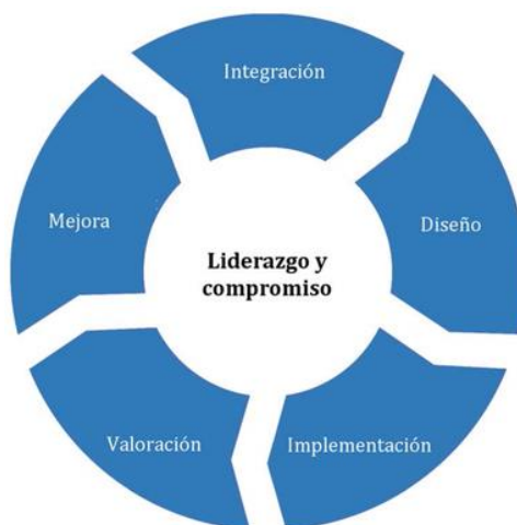
Figura 3 — Marco de referencia

La organización debería valorar sus prácticas y procesos existentes de la gestión del riesgo, valorar cualquier brecha y abordar estas brechas en el marco de referencia.